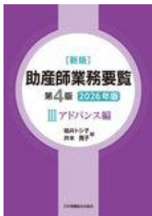
新版 助産師業務要覧 第4版 III アドバンス… 福井 トシ子 井本 寛子 日本看護協会出版会