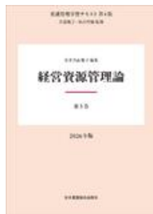
看護管理学習テキスト 第4版 第5巻 経営資… 井部 俊子 秋山 智哉 日本看護協会出版会