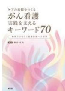
ケアの基盤をつくる がん看護 実践を支え… キーワード70 藤田 佐和 南江堂