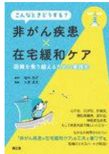
こんなときどうする？ 非がん疾患 × 在宅緩和… 非がん疾患 × 在宅緩和ケア 柏木 秀行 大屋 清文 南江堂