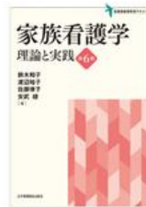
家族看護学 理論と実 践 第6版 鈴木 和子 渡辺 裕子 佐 藤 律子 安武 綾 日本看護協会出版会