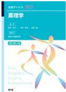
薬理学 改訂第2版 荻田 喜代一 田中 雅幸 首藤 誠 南江堂