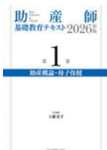
助産師基礎教育テキス ト 2026年版 第1巻 … 工藤 美子 日本看護協会出版会