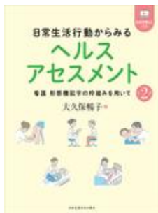
日常生活行動からみる ヘルスアセスメント… 大久保 暢子 日本看護協会出版会