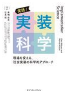
実践！実装科学 高橋 由光 石見 拓 インターメディカ