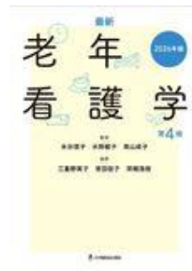
最新 老年看護学 第4版 2026年版 水谷 信子 水野 敏子 高 山 成子 日本看護協会出版会