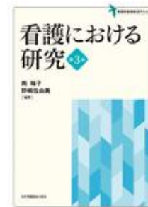
看護における研究 第3 版 南 裕子 野嶋 佐由美 日本看護協会出版会