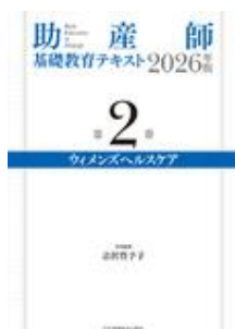
助産師基礎教育テキス ト 2026年版 第2巻 … 吉沢 豊予子 日本看護協会出版会