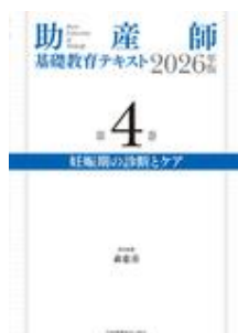
助産師基礎教育テキス ト 2026年版 第4巻 … 森 恵美 日本看護協会出版会