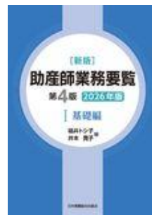
新版 助産師業務要覧 第4版 I 基礎編 202… 福井 トシ子 井本 寛子 日本看護協会出版会