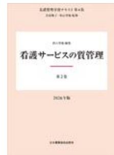
看護管理学習テキスト 第4版 第2巻 看護サ… 井部 俊子 秋山 智哉 日本看護協会出版会

*お見積をご希望の場合には下記サイトにて専用アカウントを作成してご依頼ください。 https://customer.isho.jp/