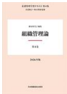
看護管理学習テキスト 第4版 第4巻 組織管… 井部 俊子 秋山 智哉 日本看護協会出版会