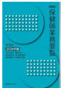
新版 保健師業務要覧 第4版 2026年版 井伊 久美子 勝又 浜子 森永 裕美子 荒木田… 日本看護協会出版会