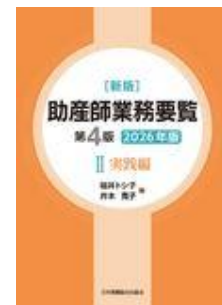
新版 助産師業務要覧 第4版 II 実践編 202… 福井 トシ子 井本 寛子 日本看護協会出版会