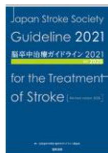
脳卒中治療ガイドライ ン2021〔改訂2025〕 日本脳卒中学会 脳卒 中ガイドライン委員会 協和企画

*お見積をご希望の場合には下記サイトにて専用アカウントを作成してご依頼ください。 https://customer.isho.jp/