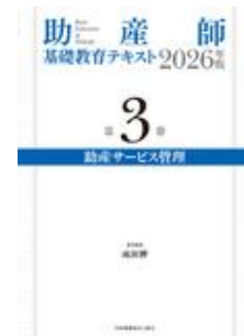
助産師基礎教育テキス ト 2026年版 第3巻… 成田 伸 日本看護協会出版会

*お見積をご希望の場合には下記サイトにて専用アカウントを作成してご依頼ください。 https://customer.isho.jp/