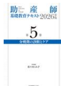
助産師基礎教育テキス ト 2026年版 第5巻 … 佐々木 くみ子 日本看護協会出版会

*お見積をご希望の場合には下記サイトにて専用アカウントを作成してご依頼ください。 https://customer.isho.jp/