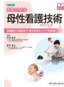
新訂第2版 写真でわか る母性看護技術 ア… アドバンス 新田 真弓 喜多 里己 インターメディカ