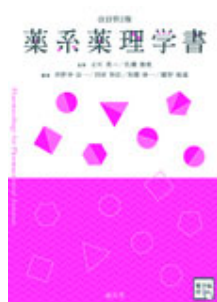
薬系薬理学書 改訂第2 版 立川 英一 弘瀬 雅教 南江堂