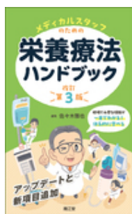
メディカルスタッフの ための栄養療法ハン… 佐々木 雅也 南江堂