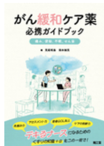
がん緩和ケア薬 必携ガイドブック 荒尾 晴恵 岡本 禎晃 南江堂