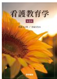
看護教育学 第8版 杉森 みど里 医学書院