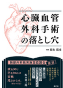
心臓血管外科手術の落とし穴 徳永 滋彦 南江堂