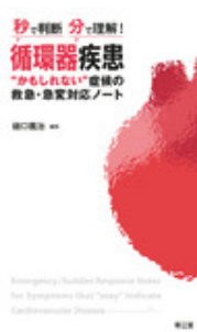
秒で判断・分で理解！ 循環器疾患“かもし… 樋口 義治 南江堂