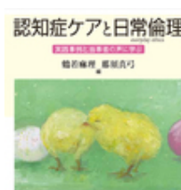
認知症ケアと日常倫理 鶴若 麻理 日本看護協会出版会