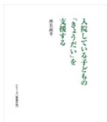
入院している子どもの「きょうだい」を支える 西名 諒平 日本看護協会出版会