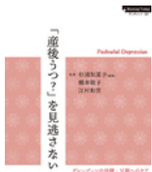
「産後うつ？」を見逃さない 杉浦 加菜子 日本看護協会出版会