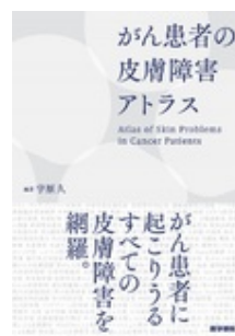
がん患者の皮膚障害ア トラス 宇原 久 医学書院

*上記価格は大学・短大（医学部が設置されていない）における同時アクセス数1の価格です。