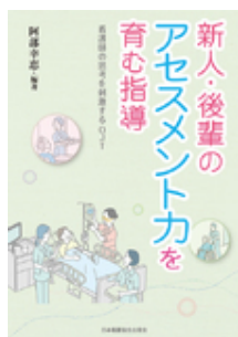
新人・後輩のアセスメント力を育む指導 阿部 幸恵 日本看護協会出版会