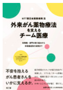
NTT東日本関東病院流 外来がん薬物療法を… NTT東日本関東病院外 来化学療法センター… 南江堂