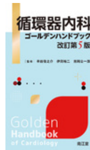
循環器内科ゴールデン ハンドブック 改訂… 半田 俊之介 伊莉 裕 二 吉岡 公一郎 南江堂