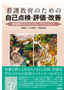
看護教育のための自己点検・評価・改善 糸賀 暢子 医学書院