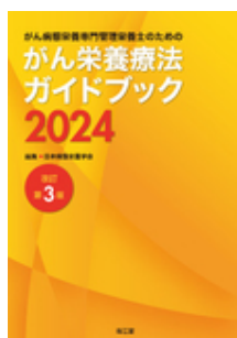
がん病態栄養専門管理 栄養士のためのがん… 日本病態栄養学会 南江堂